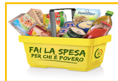
Giornata Nazionale della Colletta Alimentare