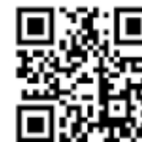
Del QR CODE che indirizzano direttamente a una rappresentazione in 3D chiara e rapida di quello che è il percorso da seguire e a un video illustrativo delle procedure di emergenza.